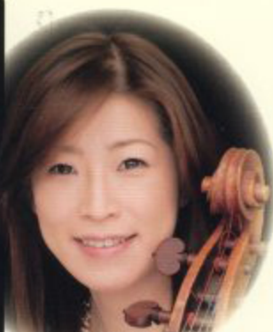
長谷川陽子(vc)