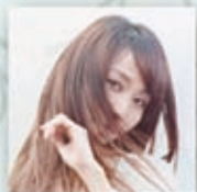
矢井田 瞳 Hitomi Yaida

1988年第57回日本音楽コンクール第1位。桐朋学園大学首席卒業後、ジュリアード音楽院に留学。1991年にLAにおいてアメリカデビューを果たし、同年フリーナ・アワーバック国際ピアノコンクールで優勝。帰国後、数々の海外の楽団と日本ツアー等で共演を果たす。これまでに「ラブソフィー・イン・ブルー」など6枚のCDをリリース。NHK-BS2「週刊ブックレビュー」の司会を6年間に亘り務めるなど多方面で活躍。幅広いレパートリー、シャープで切れのあるタッチと繊細で品格の美音、草のあるダイナミックな演奏で、聴衆を魅了する。京都市立芸術大学非常勤講師。http://www.yukomifune.com