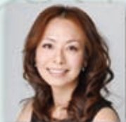
三船 優子 Yuko Mifune

1965年東京生まれ。東京芸術大学音楽学部作曲科卒業+同大学院修了。作曲家活動は1990年シルクロード国際管弦楽コンクールの最優秀賞受賞より。TVドラマ「WITH LOVE」で日本ゴールド・ディスク大賞。映画「血と骨」「春の雪」「蝉しぐれ」「利休にたずねよ」で日本アカデミー賞優秀音楽賞。「闇の子供たち」で毎日映画コンクール音楽賞。「レッドクリフ」で香港電影金像獎最優秀音楽賞など、受賞歴多数。他の代表作は映画「殺人の追憶」「舞妓 Haaan!!!」「聯合艦隊司令長官 山本五十六」「許されざる者」やNHK大河ドラマ「義経」「義経」など。昨年ジョン・ウー監督と再びタッグを組み映画「THE CROSSING 太平輪」の音楽を担当。本年には映画「Lost in White」「二重生活」「星籠の海」 探偵ミタライの事件簿」などが公開予定。