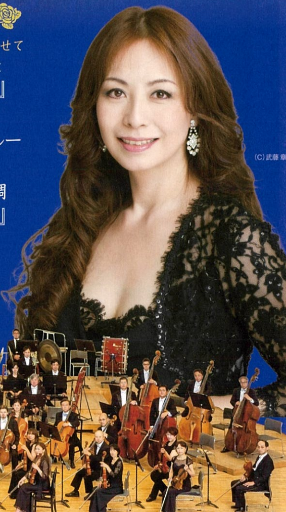
(C) 武藤 章