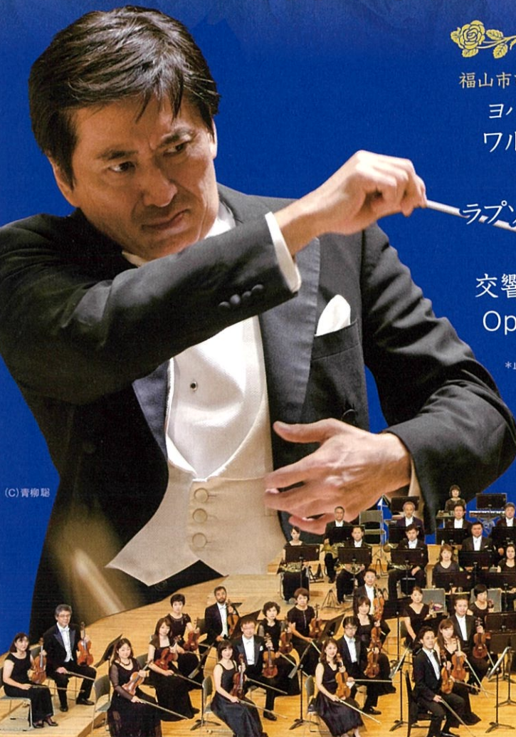
(C) 青柳 聡