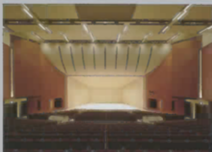
ハーモニーホール(786席)

奏でられた音が客席の隅々まで美しく繊細に響き渡り、弾き手、聴衆を結ぶ上級の音響空間。管弦楽、室内楽に最適な音響環境を誇り、これまで多くの演奏家から高評価を得ている。またホールには世界的名器ベーゼンドルファー280、スタインウェイD274のフルコンサートピアノ2台を備えています。