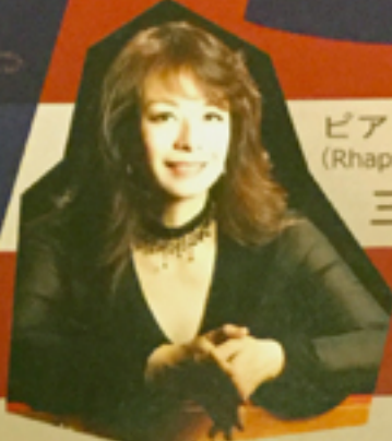
ピアノ独奏 (Rhapsody in Blue)