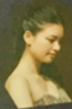
ピアノ独奏 (ニューヨークからの4つの絵)