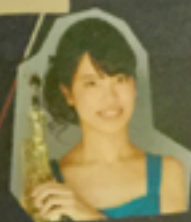
サクソフォン独奏 (ニューヨークからの4つの絵)