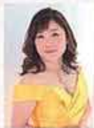
山本昌代 (ソプラノ)