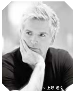
◎ 上野 隆文

マンハイム国民劇場音楽総監督、イスラエル交響楽団音楽監督。2003年から2008年までベルリン国立歌劇場カペルマイスター兼音楽監督(ダニエル・バレンボイム)助手を務め、ウィーン国立歌劇場、ロスアンジェルス・オペラ、バイエルン国立歌劇場、ワシントン・ナショナル・オペラ、メトロポリタン・オペラ、英国ロイヤル・オペラ、パリ・オペラ座など世界の主要歌劇場に出演。新国立劇場には2004年『ファルスタッフ』以来毎シーズン登場し、2006年新制作『イドメネオ』をはじめ、『ニーベルングの指環』全曲(2009年『ラインの黄金』『フルキューレ』、2010年『ジークフリート』『神々の黄昏』)の指揮で大好評を博した。東京フィルには2005年4月定期公演以来数多く登場し、2010年4月より2015年3月まで常任指揮者を務めた。現在は桂冠指揮者に就任している。