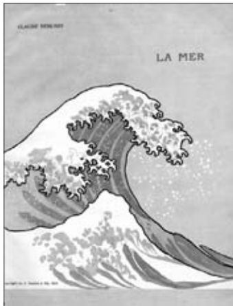
ドビュッシーの交響詩『海』スコアの表紙には葛飾北斎「神奈川沖浪裏」の一部が用いられています。

プッチーニの歌劇『蝶々夫人』もまた日本をモチーフに作曲された名作。(カラヤン指揮ウィーン・フィルのCDジャケットより)