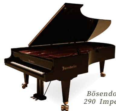
Bösendorfer 290 Imperial