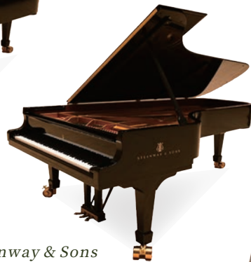
Steinway & Sons D-274 (New York)