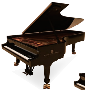
Steinway & Sons D-274 (Hamburg)